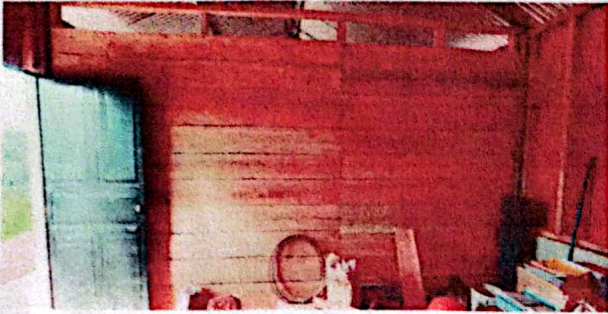
Foto1: Se requiere la sustitución de la pared divisoria.