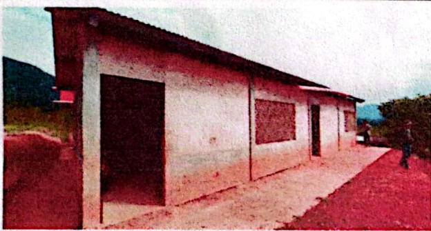
Foto 3: Se observa que faltan ventanas y cambiar las que ya estan y sustituir los canales.